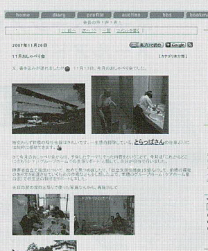
前橋市手をつなぐ育成会 おしゃべり広場